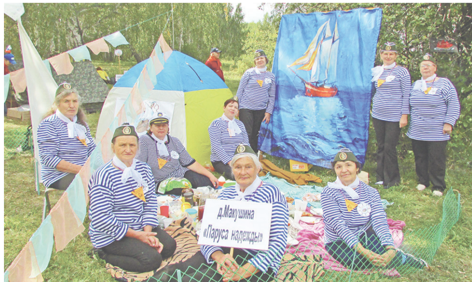
Макушинская команда «Паруса надежды» на привале.