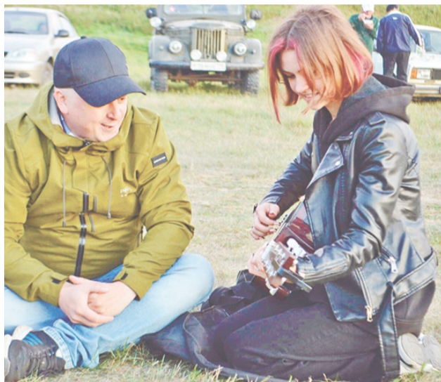
Песни звучали до утра.

ских, туристических, строевых, походных песен и, конечно, пели вместе с ними.