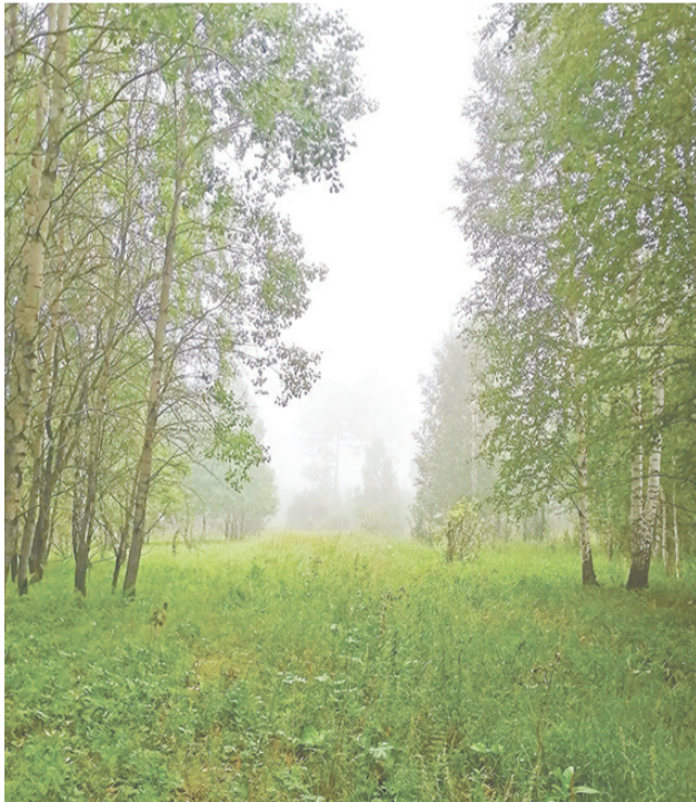
Август 2023 года. Раннее утро. д. Малкова.