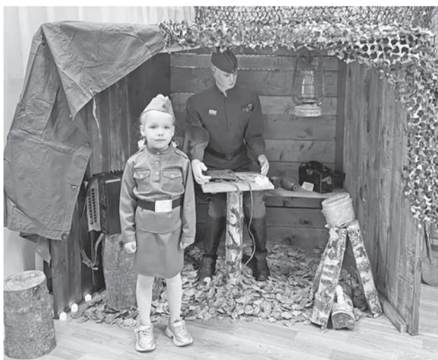
Выставку «О войне расскажут ордена» посетили 580 человек.

Е. СПИРИНА, специалист по экспозиционной и выставочной деятельности.