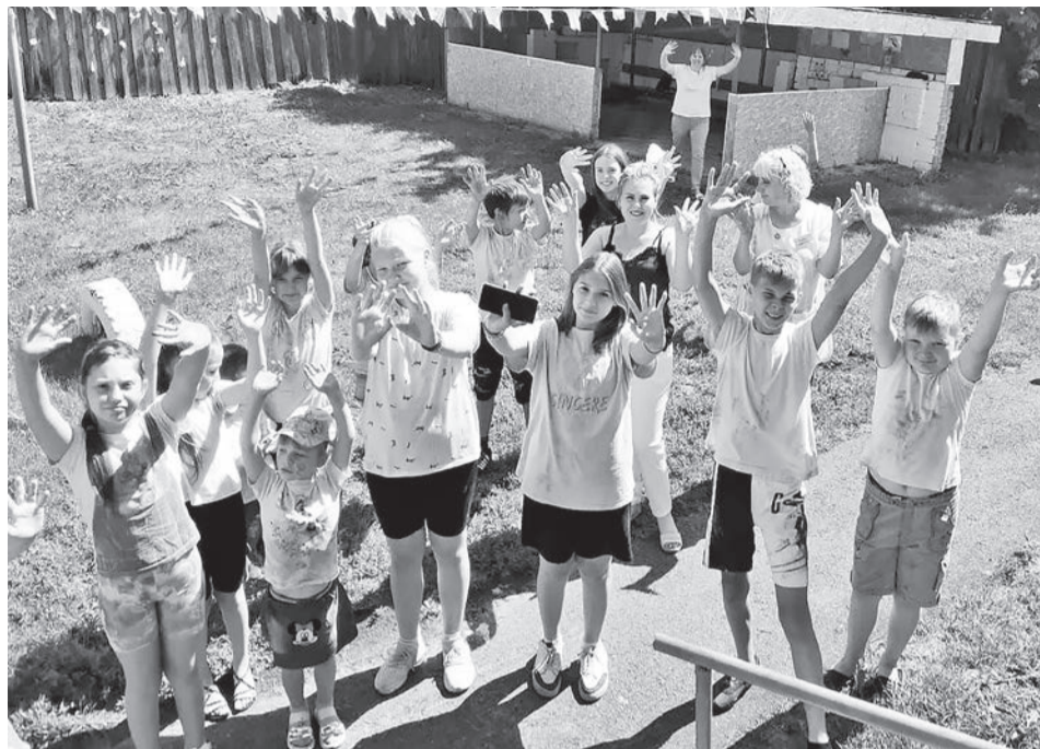
На площадке для ребят были организованы игры и дискотека.

Каждый день был ярким и интересным. Проходили конкурсно-игровые, развлекательные программы – «Цветной калейдоскоп» с красками Холи, «День Нептуна», «Поле чудес» и другие. Организовали для детей викторину «Лужайка дружбы». Воспитанники с удовольствием принимали участие, отгадывали загадки, отвечали на вопросы, были активны и эмоциональны в узнавании летних явлений