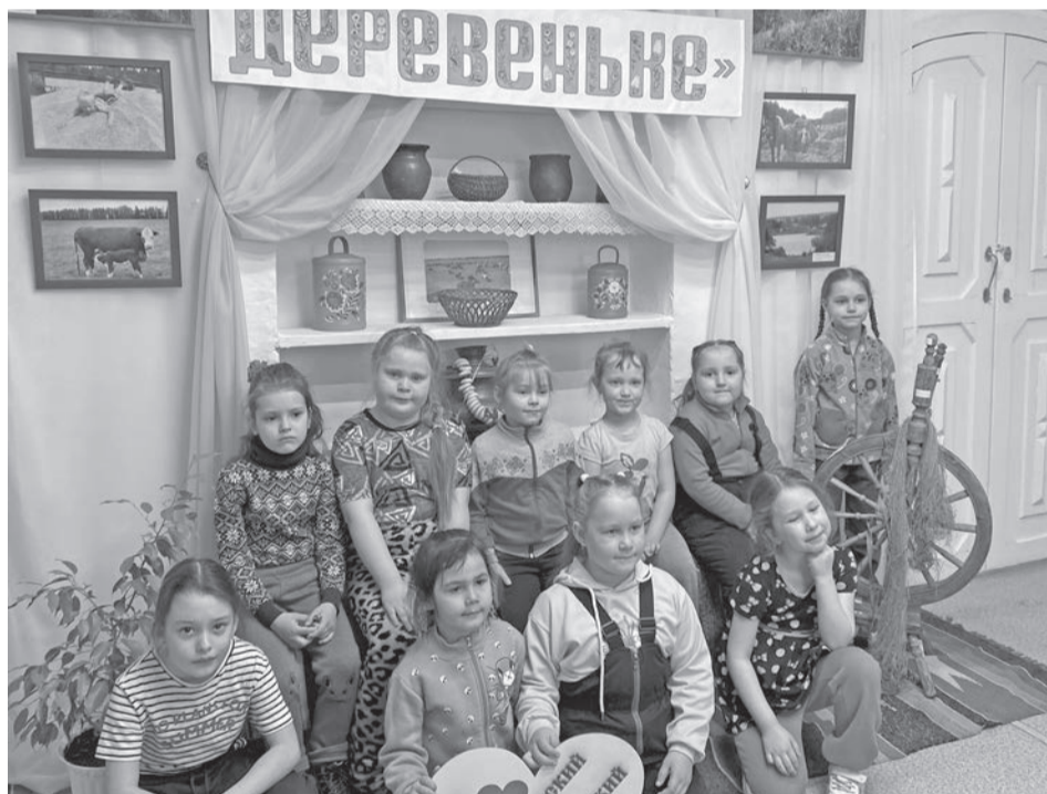
Выставку «Пройдём по деревеньке» провели уже в 24-й раз.

Традиционная творческая выставка «Пройдём по деревеньке» уже в двадцать четвёртый раз открыла свои двери. На выставку 330 человек представили 350 работ. Герои любимых книг предстали перед посетителями во всей красе: это и знаменитый Чебурашка, и румяный Колобок, и Алиса из страны Чудес, и Гарри Поттер, и