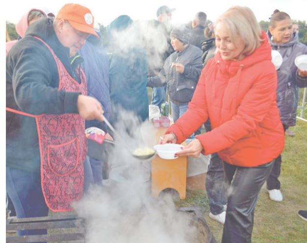
Хозяева праздника угощали «ницинской» ухой и похлёбкой с костра.