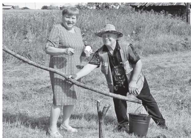
На днем деревни Дягилевой.