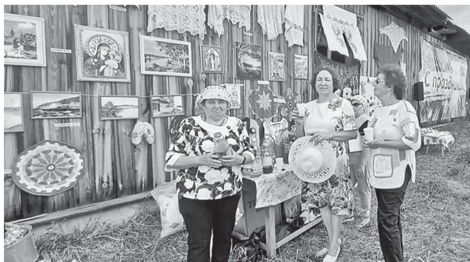
Многие приняли участие в конкурсе напитков.