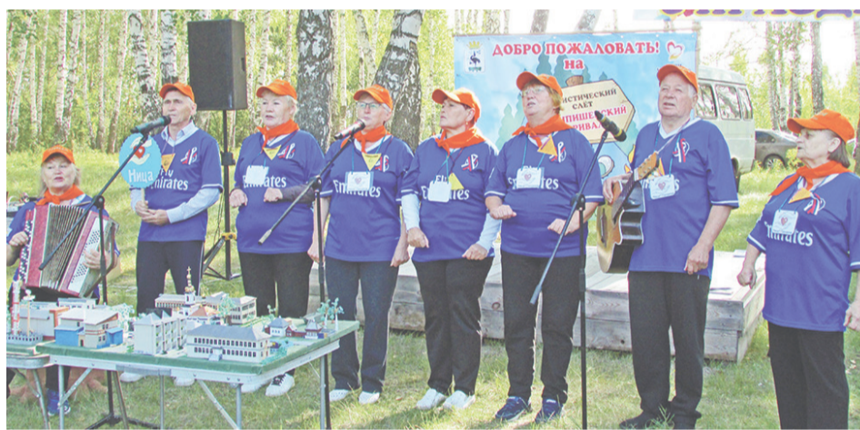
Команда «Ница» из Городища отмечена за артистизм.