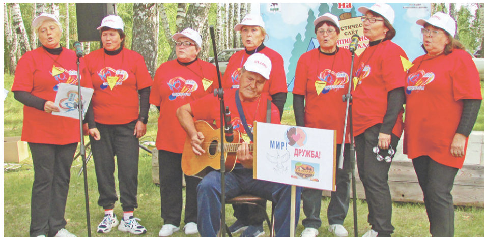
«Шкрабы» – победители турслёта «Шипишенский привал-2023».