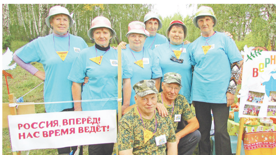
«Верные друзья» из Краснополянского отмечены за оригинальность.

На прошлой неделе в Байкалово в десятый раз стартовал районный туристический слёт «Шипишенский привал». Участие приняли 10 команд по 8 человек.