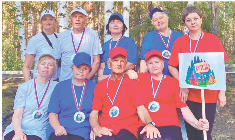
Команда «Бутсы» в областном турслёте заняла второе место.